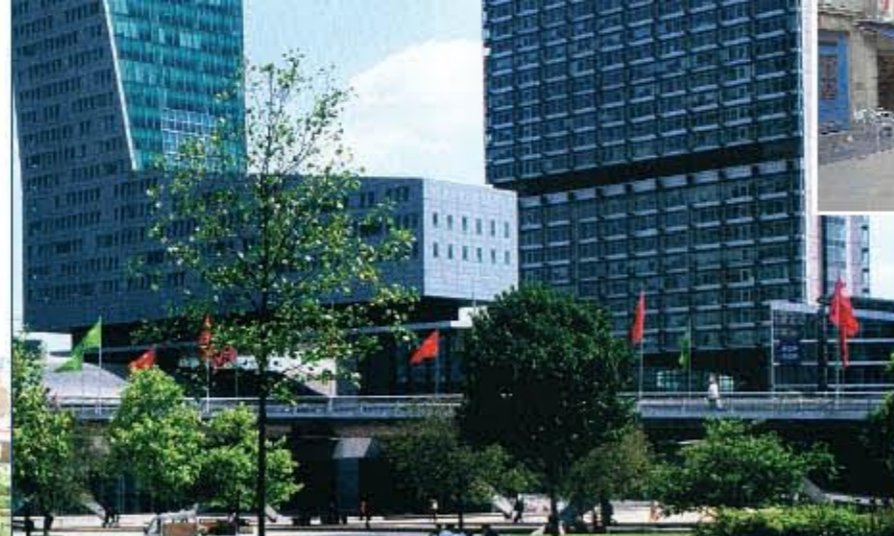
Centre commercial Euralille et gare Lille-Europe