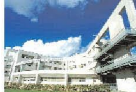
Centre Hospitalier Régional