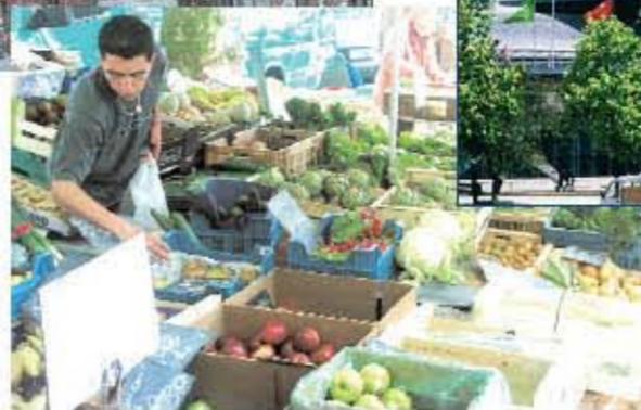
Marché de Wazemmes