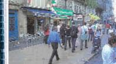
Commerces quartier Wazemmes